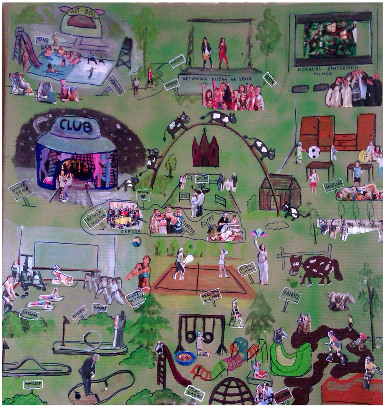
Tablica potrzeb młodzieży gminy Bielsk – sporządzona przez podopiecznych GOK w Bielsku